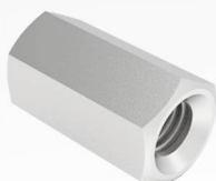
Гайка соединительная DIN6334