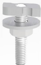
Болт быстрого монтажа. M8